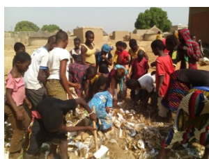
29 nov sensibilisation sur les déchets à l'école Animation avec Fido